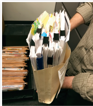
Legacy case management system

Das WellCare Creative Services Team liefert das komplette Regulierte- und Marketingmaterial in einem breiten Portfolio von 60 Medientypen in 30 verschiedenen Sprachen für den externen und internen Gebrauch. Die Arbeit des WellCare Creative Services Teams war zu 90 Prozent papierbasiert: Dokumente wurden in Fallakten versammelt; Arbeitsabläufe erfolgten manuell, mit Fallakten, die physisch vom Team zum Team gereicht wurden; und Proben, Nachweise und andere Arbeitsergebnisse mussten vorerst gedruckt und den Akten hinzugefügt werden. Die Arbeit mit dieser Art von Fallmanagement-System war sehr zeitaufwendig und ineffizient, und führte oft zu Schwierigkeiten mit Engpässen.