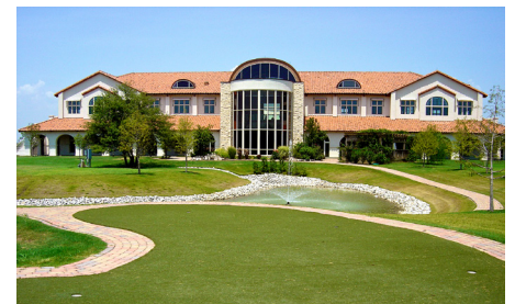
US Headquarters, Dallas, Texas

Comenzando a partir del diseño de formularios mainframe en 1988, a través de las herramientas de formateo de documentos más potente, cross-platform y cross-industry, ISIS Papyrus ofrece desde el 2000 la única Plataforma de Información de Negocio para contenidos y procesos .