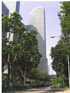
Asia-Pacific Headquarters, Singapore

El Grupo ISIS Papyrus es un experto único en su nicho de mercado. Más de 250 empleados sustentan una tradición de excelencia en cumplir los requerimientos de los clientes basándose en una idea única en las relaciones cliente-empleado, empleado-a-contenido y contenido-a-proceso. El grupo de capital privado, rentable por encima de la media del sector, tiene sustanciales reservas de capital y un crecimiento del 10 por ciento anual.