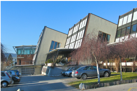
Corporate Headquarters, Vienna, Austria