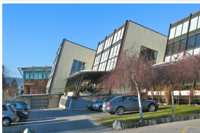
Siège social principal, Vienne, Autriche

Belgique/Braine l'Alleud, France/Paris, Italie/Ivrea, Hollande/Amsterdam, Pays Nordiques/Copenhague, Espagne/Madrid, Barcelone, San Sebastián, Seville, UK/Kingsclere