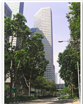
Siège social Asie-Pacifique, Singapour