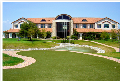
Siège social US, Dallas, Texas