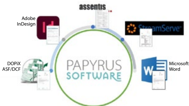
Migrazione automatica a Papyrus

Facciamo affidamento sulle best-practice e sul nostro collaudato approccio alla migrazione, che prevede l'analisi iniziale di documenti e moduli esistenti fino alla completa integrazione nella piattaforma Papyrus CCM e all'adattamento alle esigenze specifiche del cliente. Documenti e moduli vengono valutati in termini di utilizzo, canali di output, proprietà e complessità, quindi vengono creati profili dettagliati dei contenuti e un piano di migrazione.