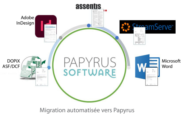
Migration automatisée vers Papyrus

Notre approche de migration va de l'analyse initiale des documents et formulaires existants jusqu'à l'intégration complète dans la plateforme Papyrus CCM et l'adaptation aux exigences individuelles des clients.